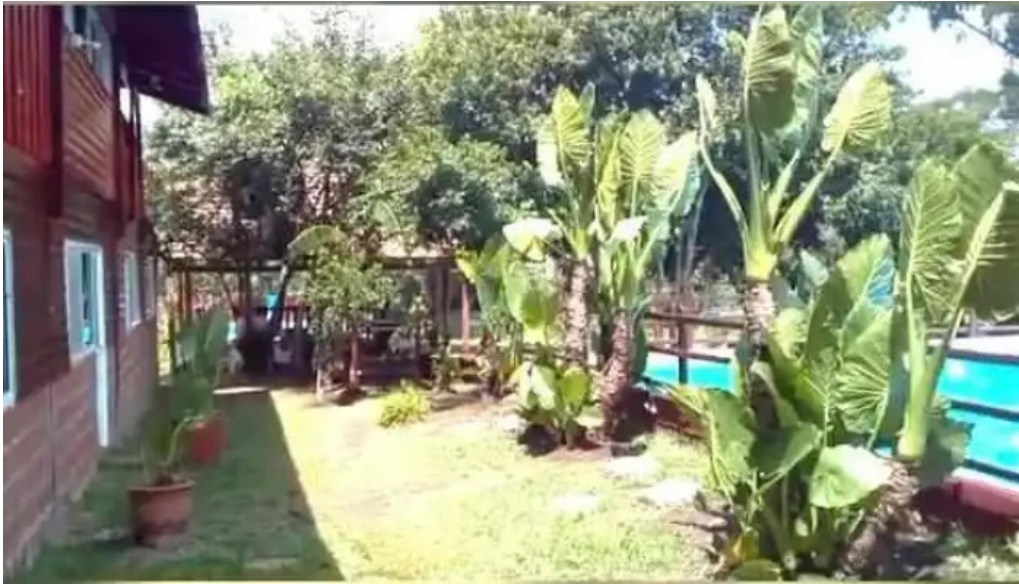
Cerro cora videos