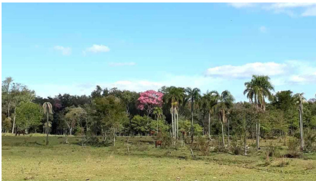
Cerro cora descuentos