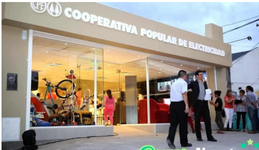
Cpe catrilo catrilo