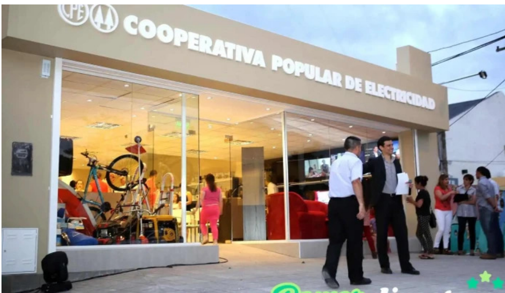
Cpe catrilo cerca de mi