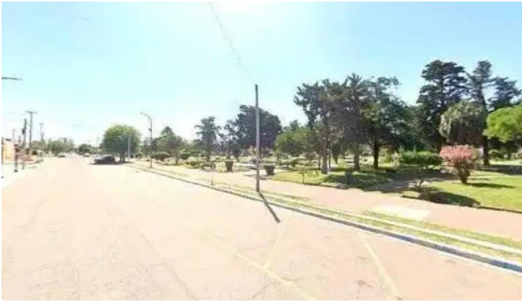
Cpe catrilo cerca de mideg