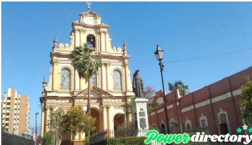
Capital abierto ahora