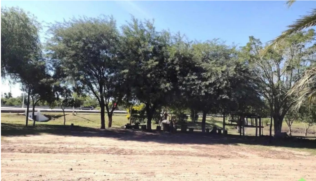
Cap solari cap solari