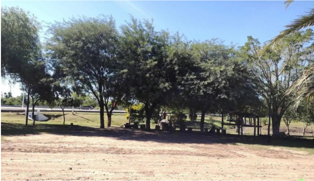
Cap solari opiniones