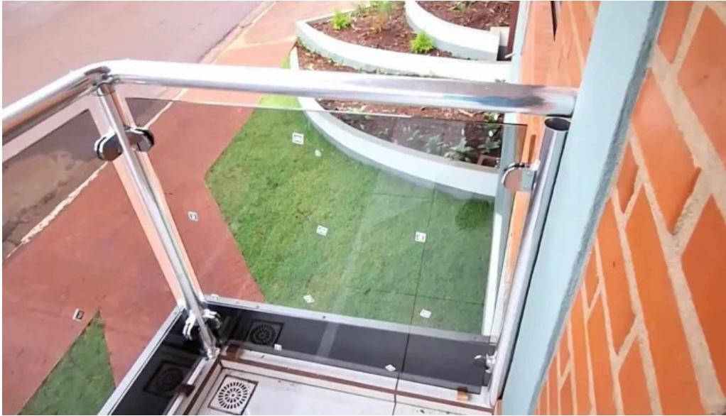
Bernardo de irigoyen videos