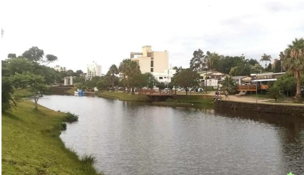
Bernardo de irigoyen bernardo de irigoyen