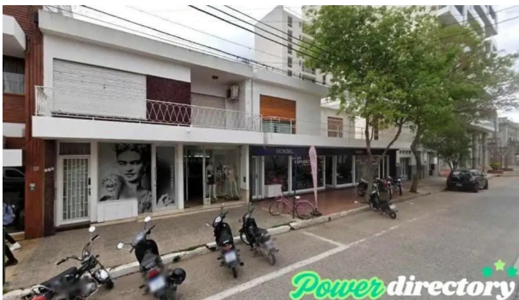
Tarjeta bell ville bell ville