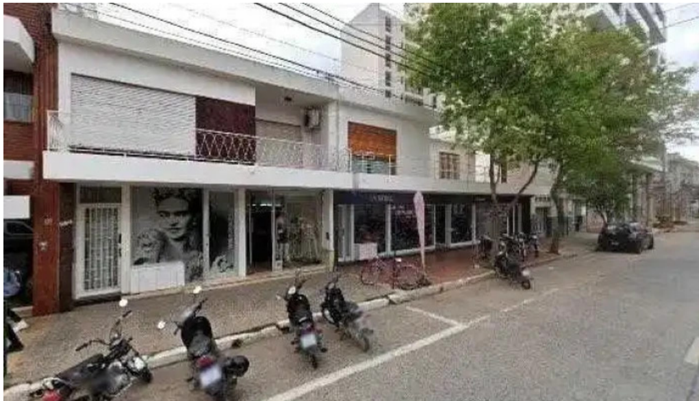
Tarjeta bell ville instagram