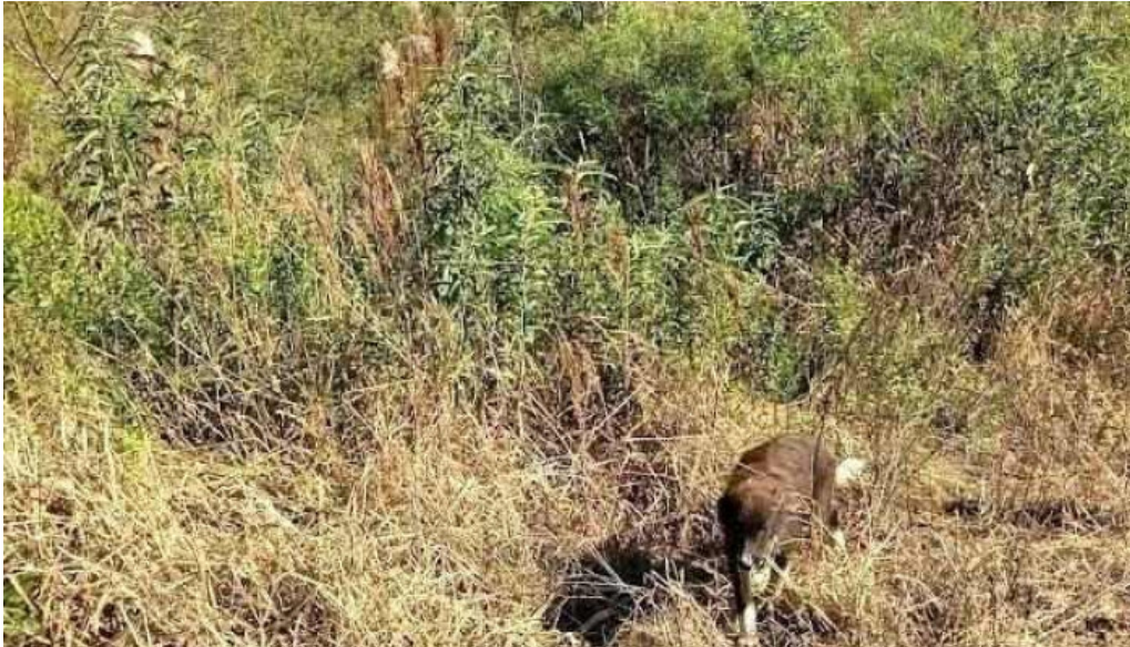
Arroyo del medio arroyo del medio