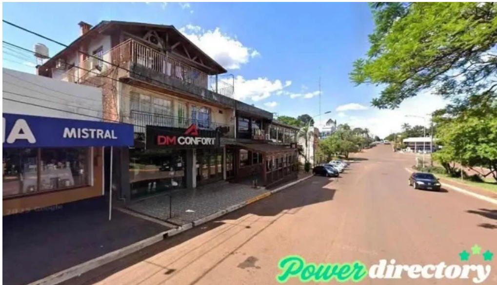
Cooperativa cainguas aristobulo del valle