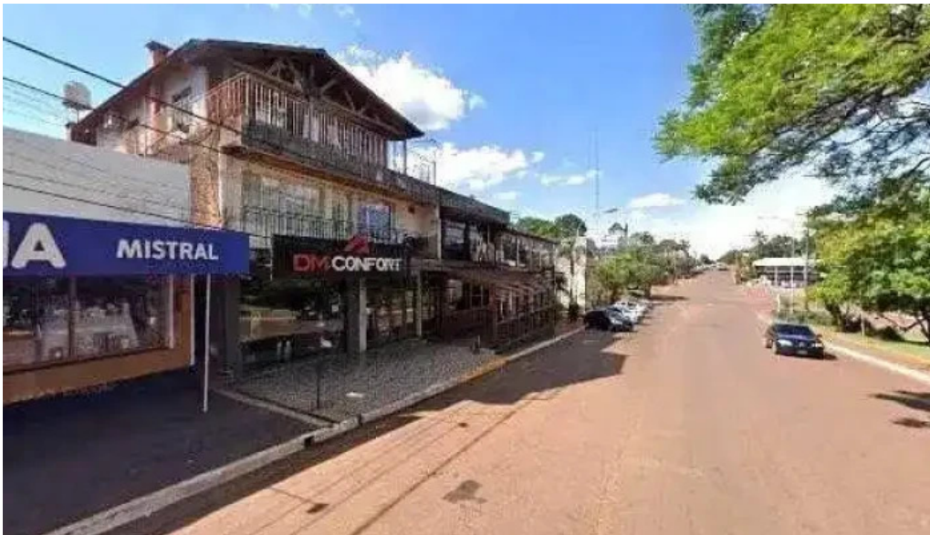
Cooperativa cainguas puntaje