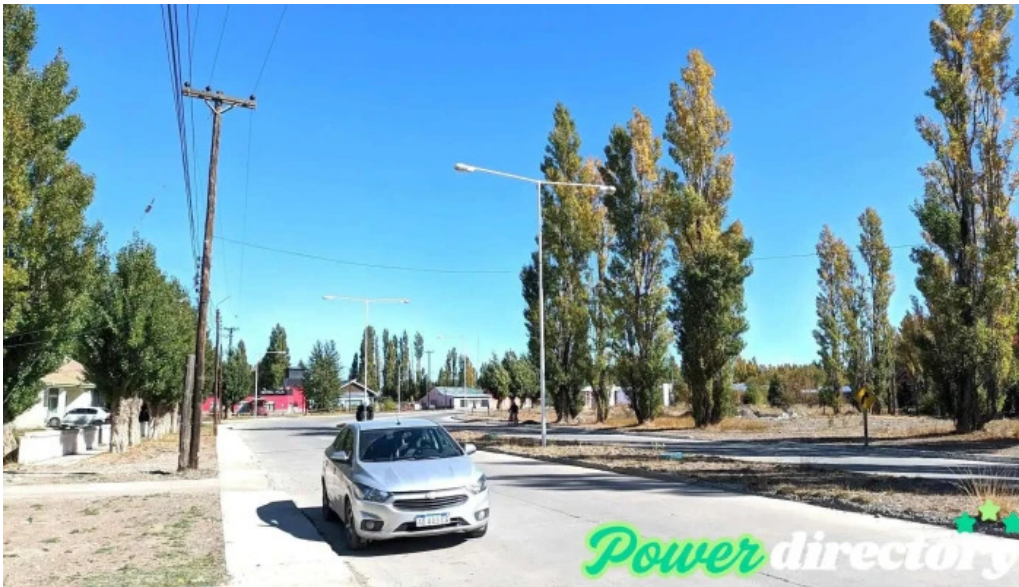
Alto rio senguer precios