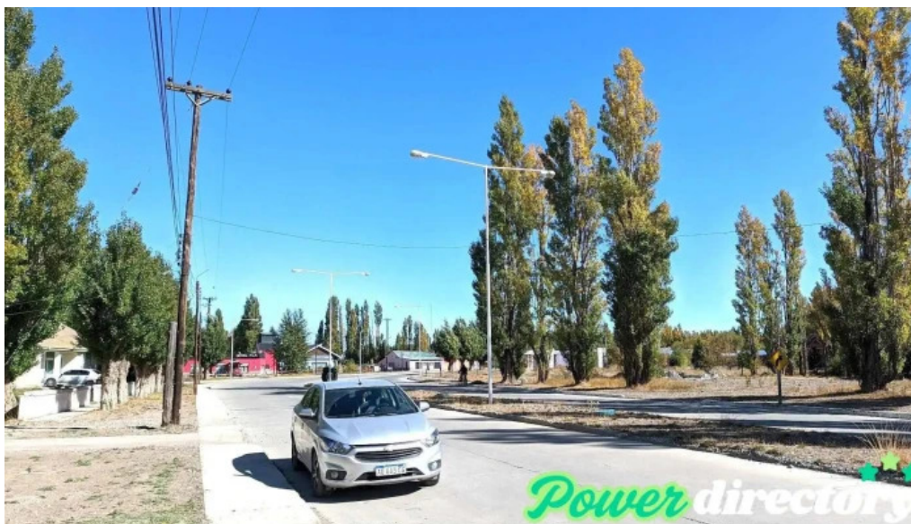
Alto rio senguer alto rio senguer