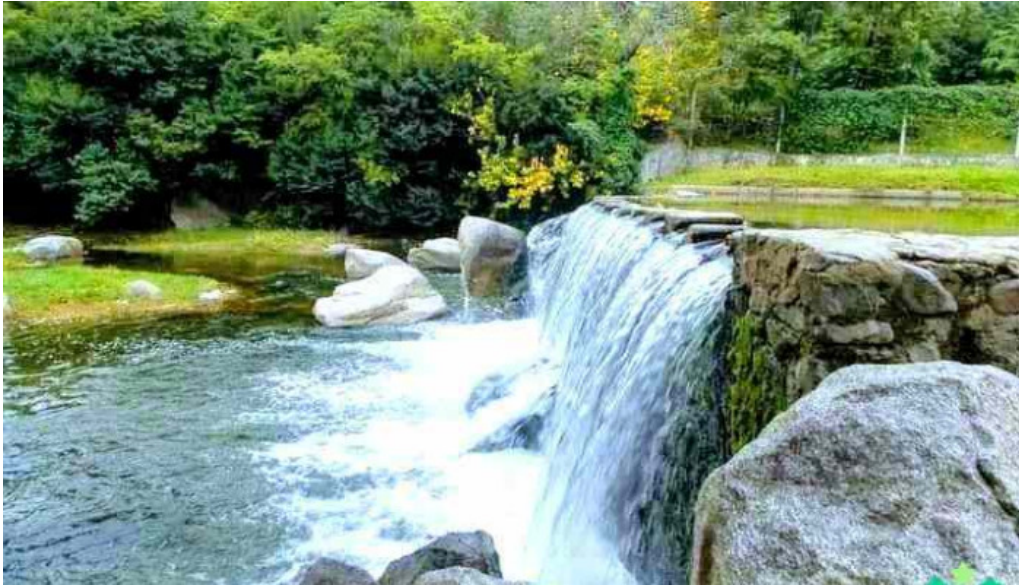
Agua de oro donde