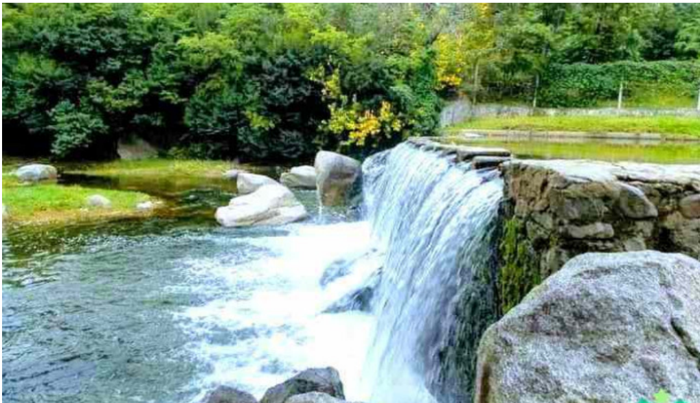
Agua de oro agua de oro