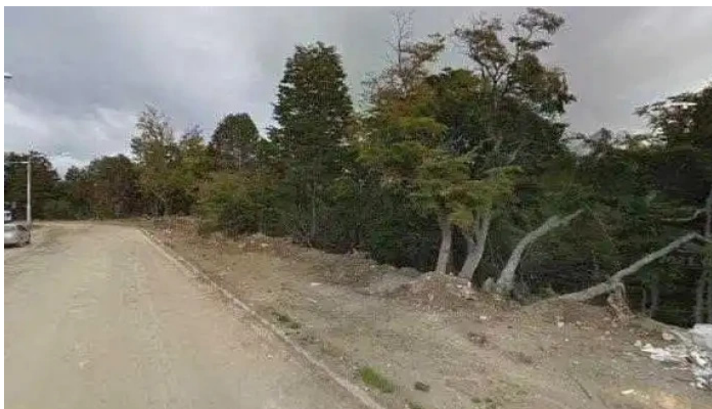
Comercializadora del sur opiniones