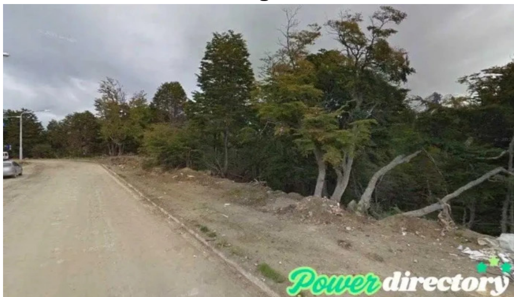
Comercializadora del sur ushuaia