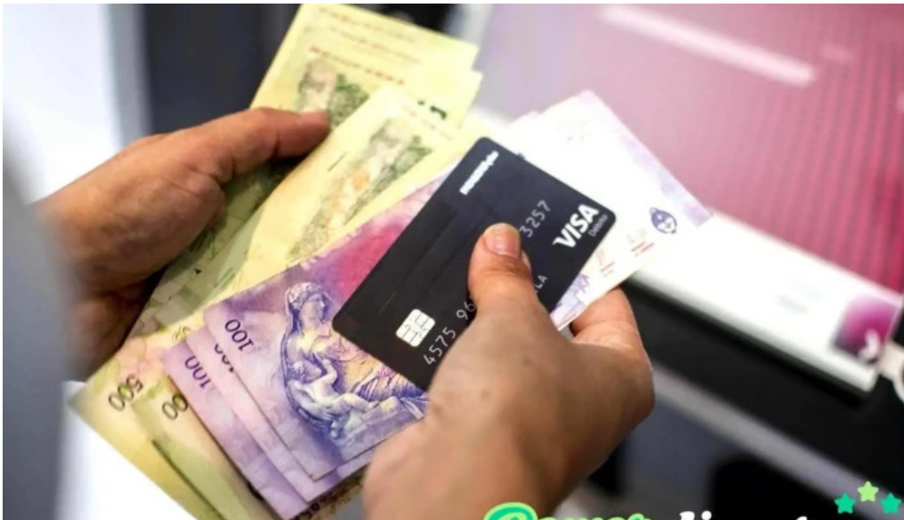
Crediman del propietario