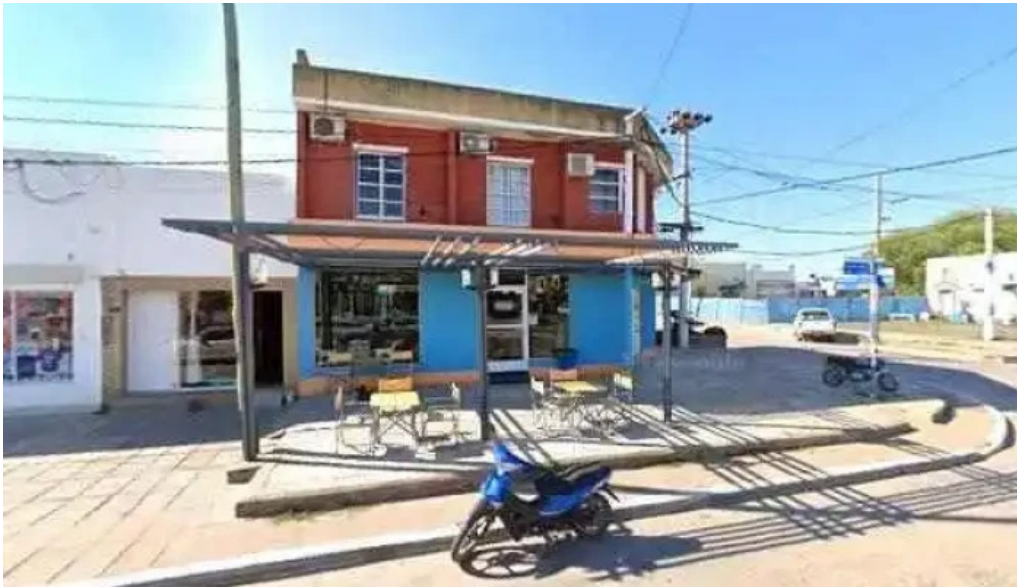
Federar como llegar