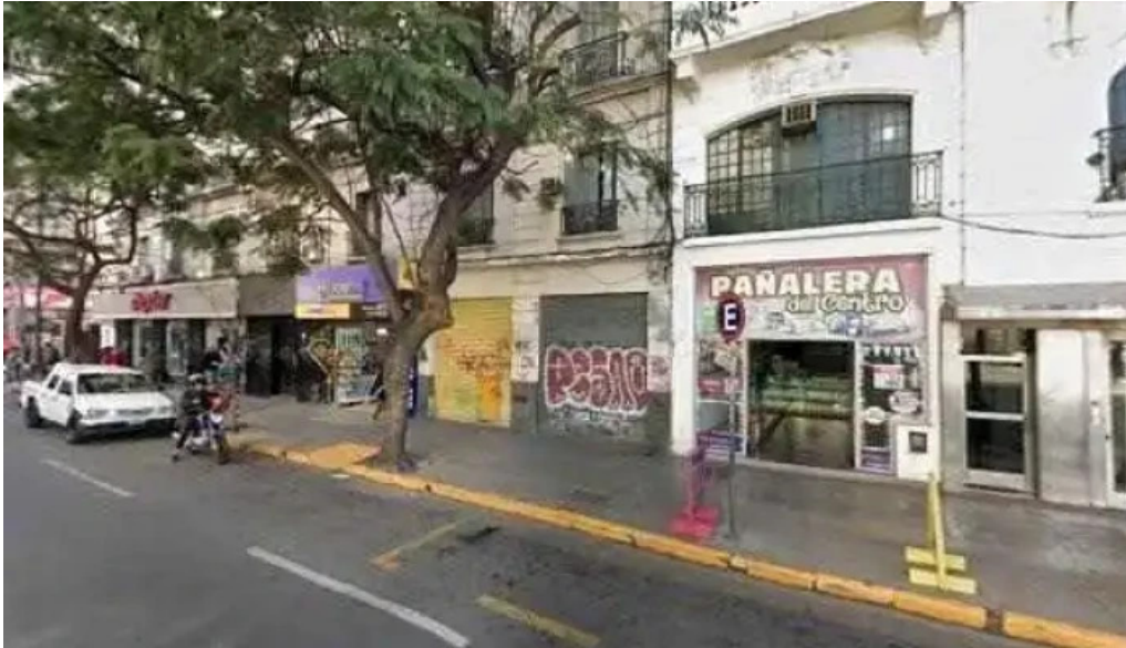
Facil prestamos personales ubicacion