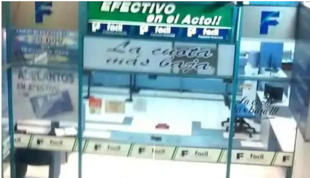
Facil prestamos personales cordoba