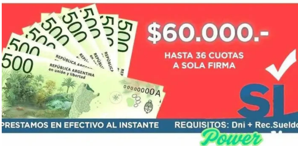
Prestamos cordoba argentina