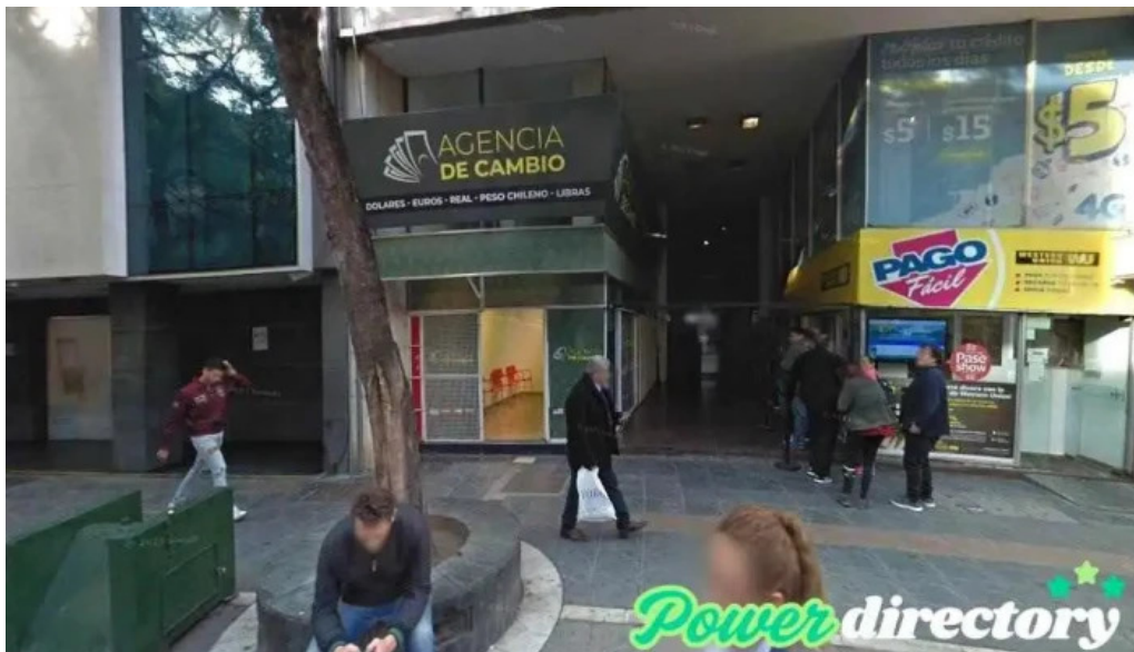
Afincor bursatil s a x5000ehc