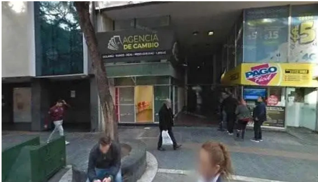
Afincor bursatil sa abierto ahora