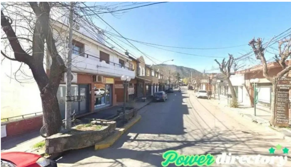
Financiera 888 santa rosa de calamuchita