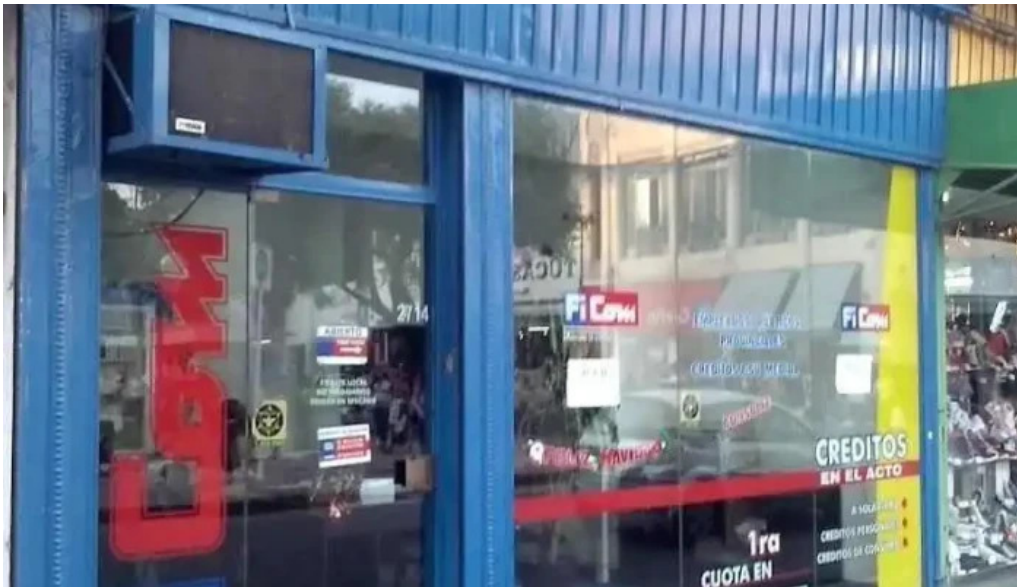
Creditos ficom santa fe de la cruz