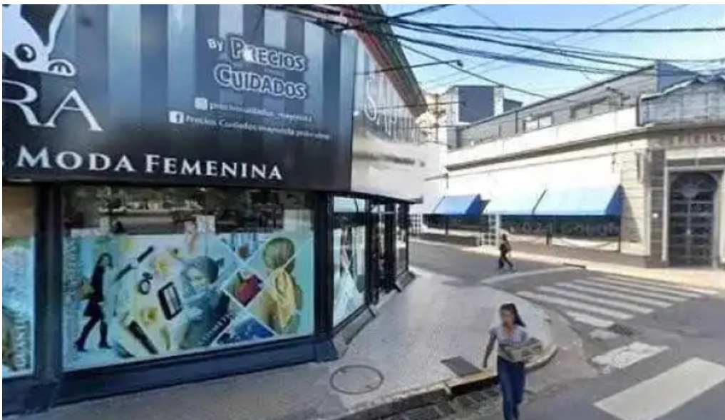
Creditos ficom puntajedeg