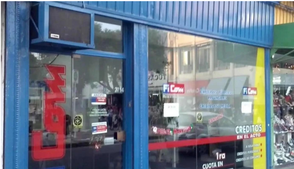
Creditos ficom puntaje