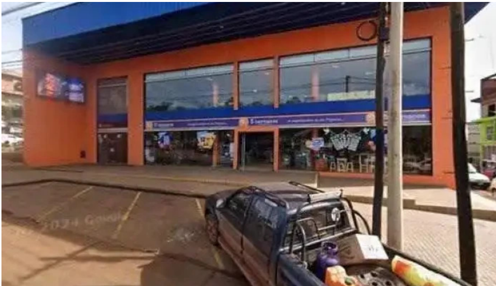
Crediser argentina sa stand san vicente telefono