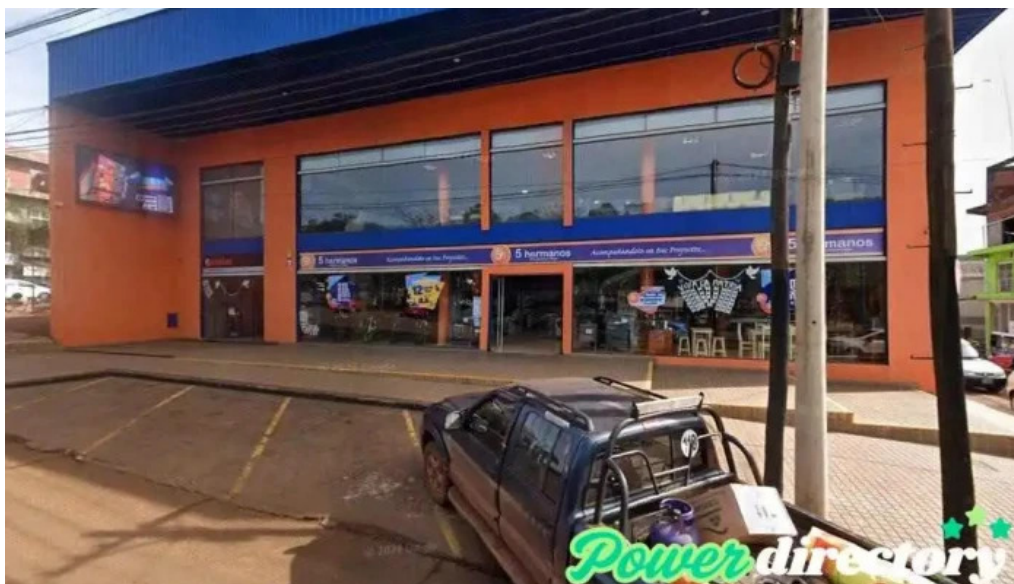
Crediser argentina s a stand san vicente san vicente