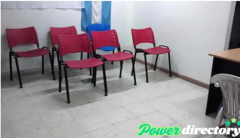
Crediya san miguel de tucuman