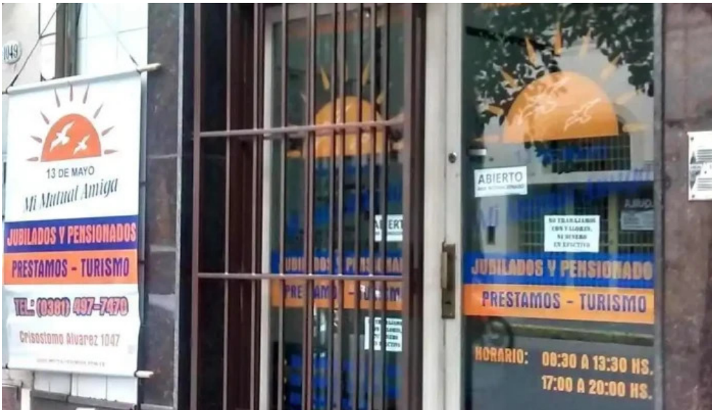
13 de mayo direccion