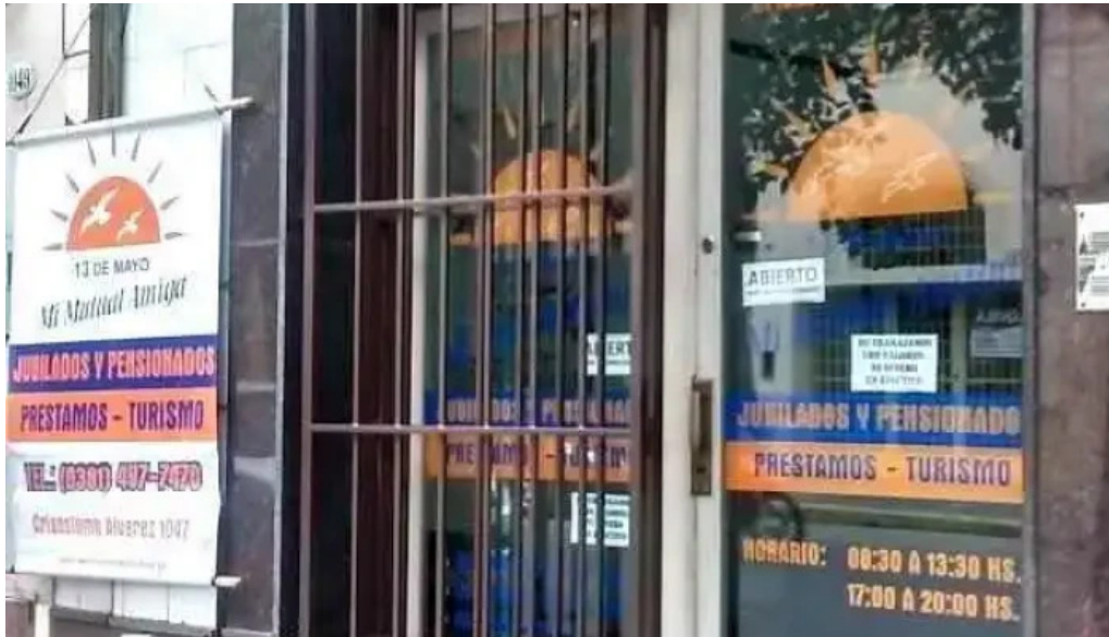
13 de mayo san miguel de tucuman