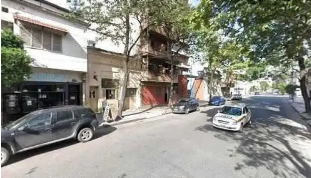
13 de mayo direcciondeg