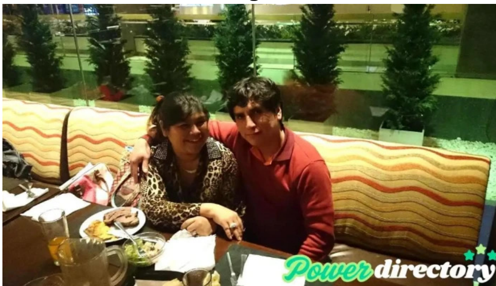
Oscar del norte finanzas personales rosario