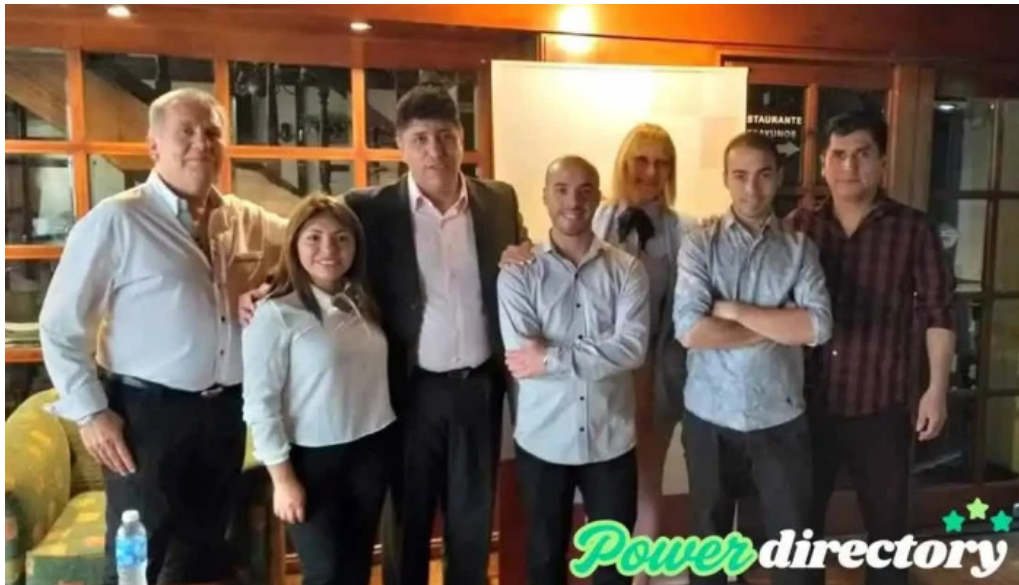
Oscar del norte finanzas personales del propietario