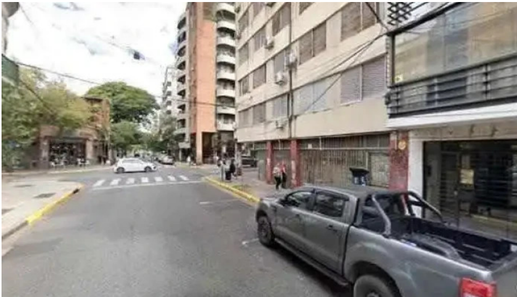
Oscar del norte finanzas personales horario