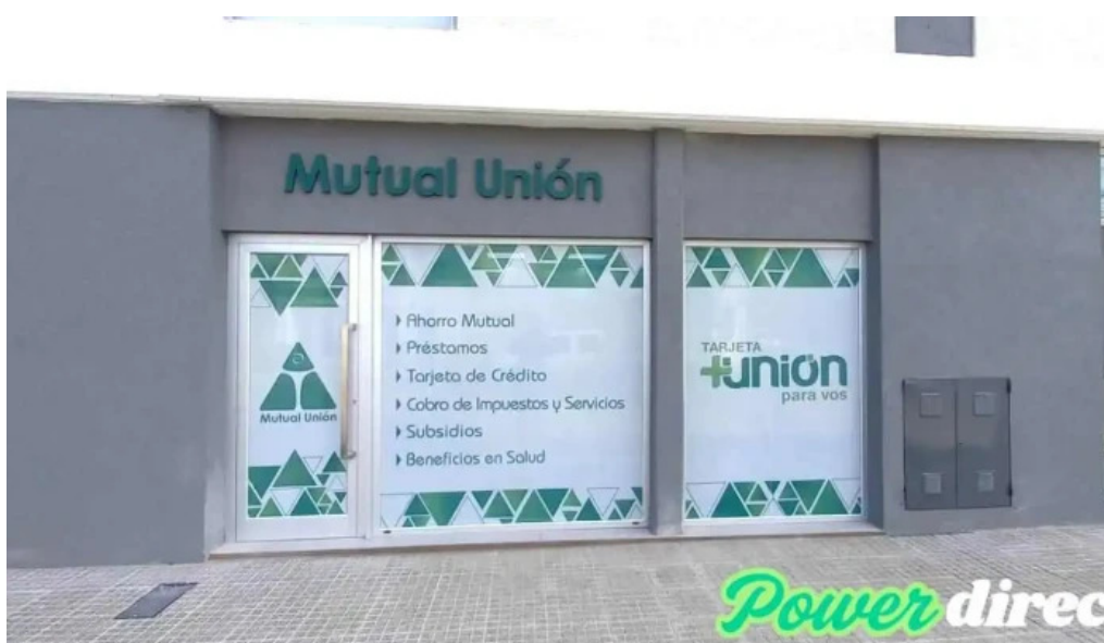
Mutual union suc rfla catalogo