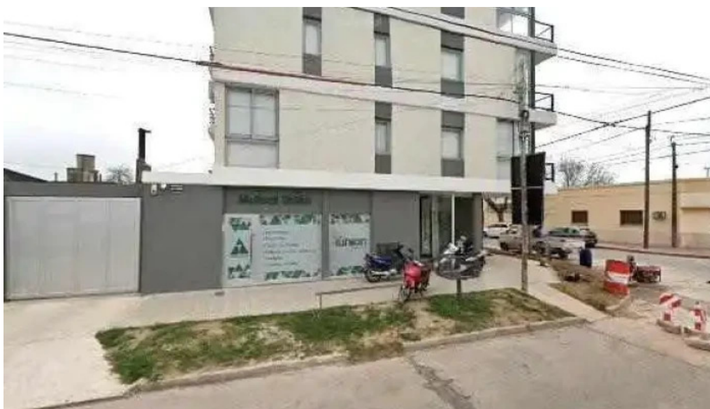
Mutual union suc rfla catalogodeg