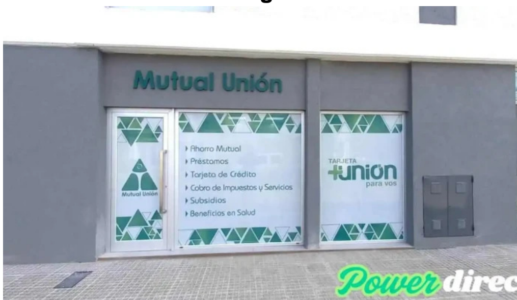
Mutual union suc rfla rafaela