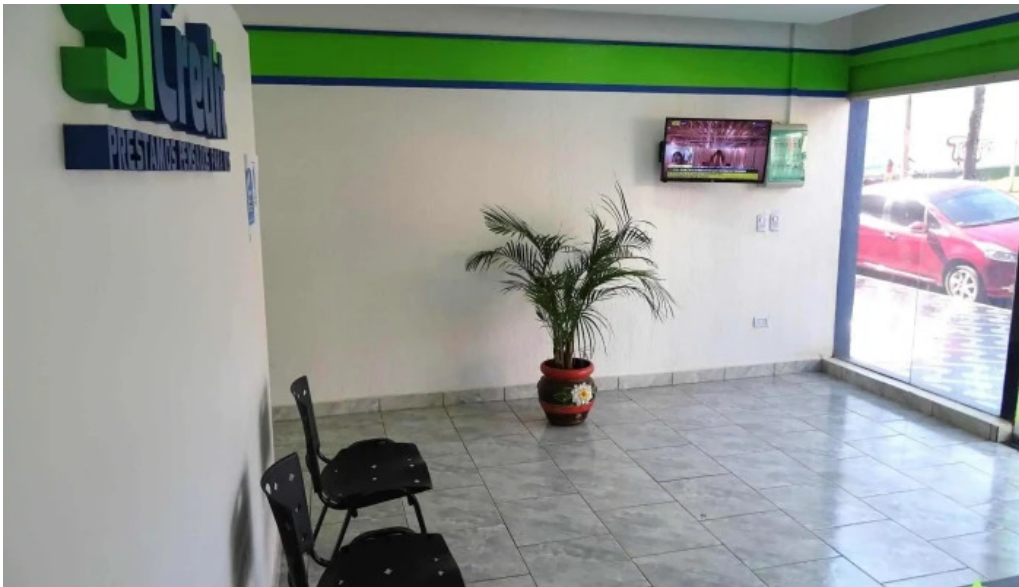
Sicredit prestamos pensados para vos descuentos