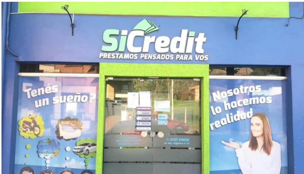
Sicredit prestamos pensados para vos exterior