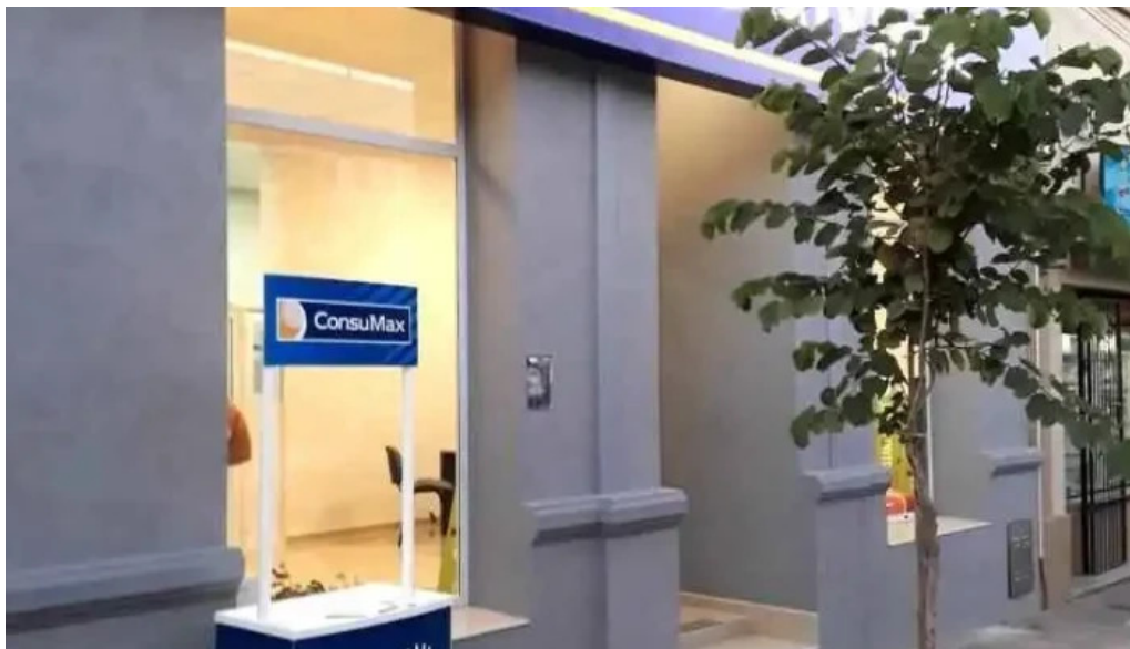
Consumax la paz