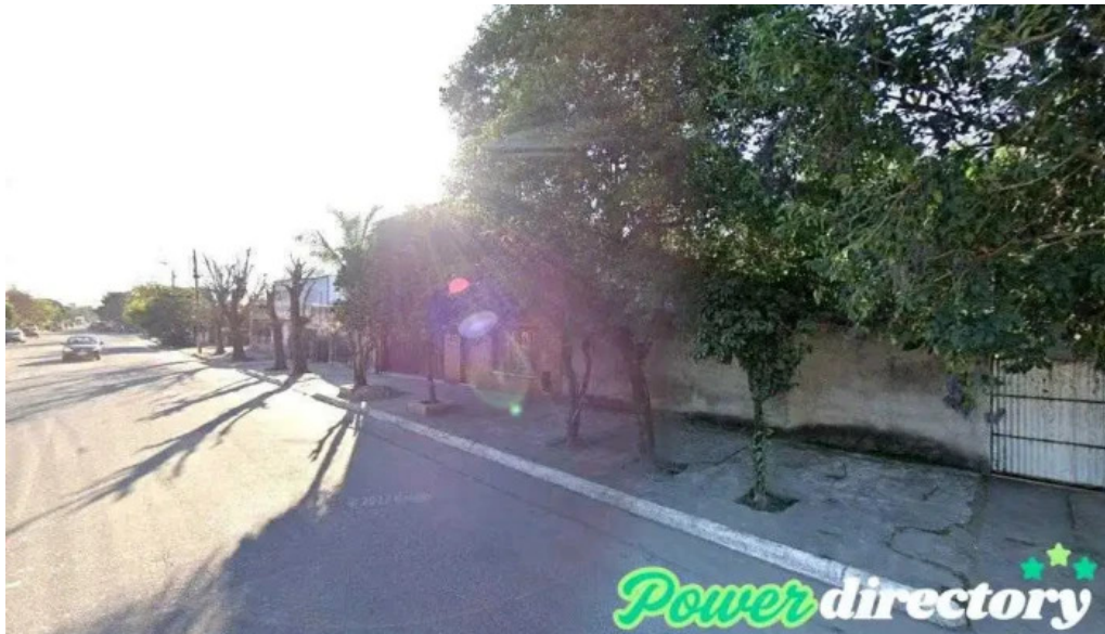
Prestamos nieva famailla