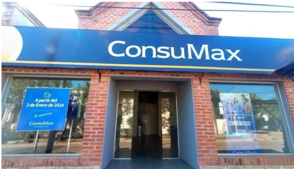
Consumax bella vista