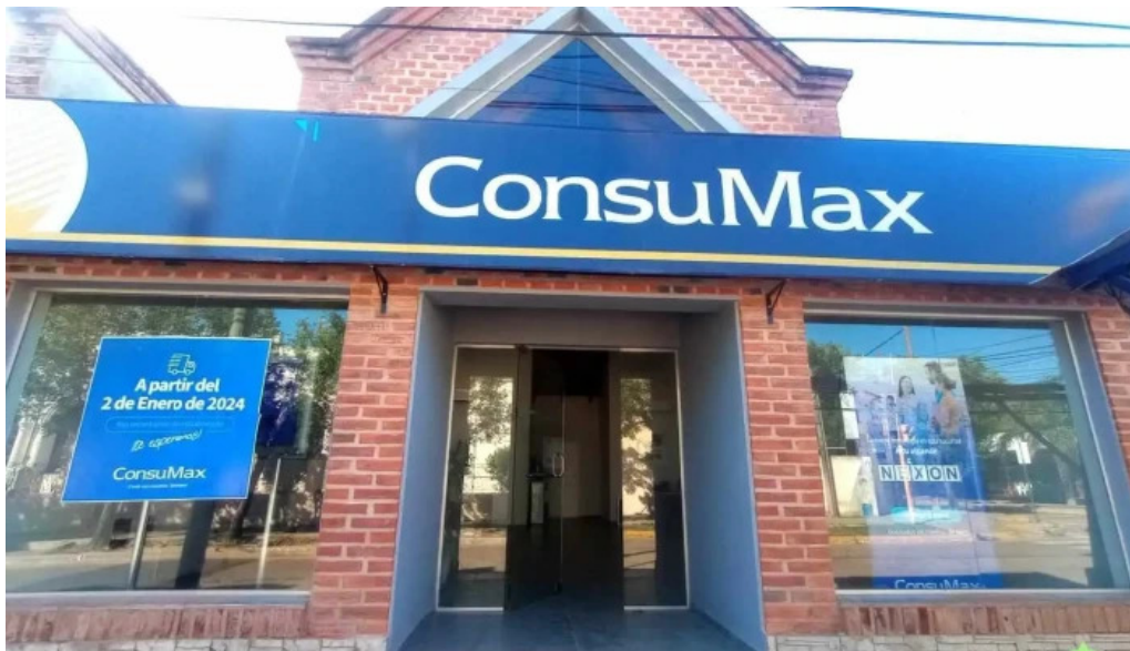
Consumax como llegar