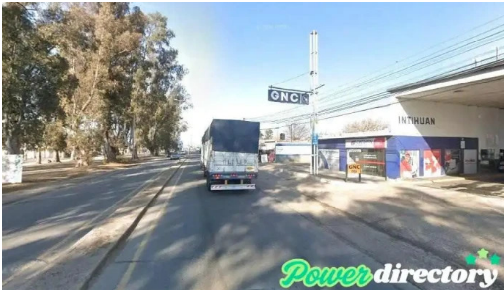
Financiaciones alta gracia alta gracia