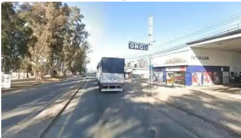
Financiaciones alta gracia puntaje