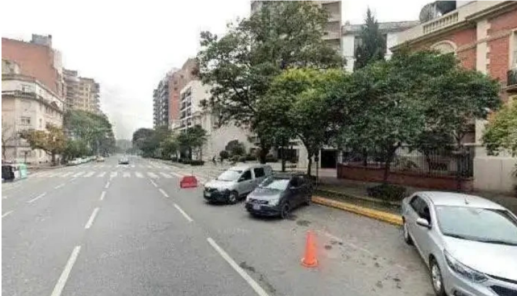
Caja de prevision social para profesionales en ciencias economicas de cordoba puntajedeg