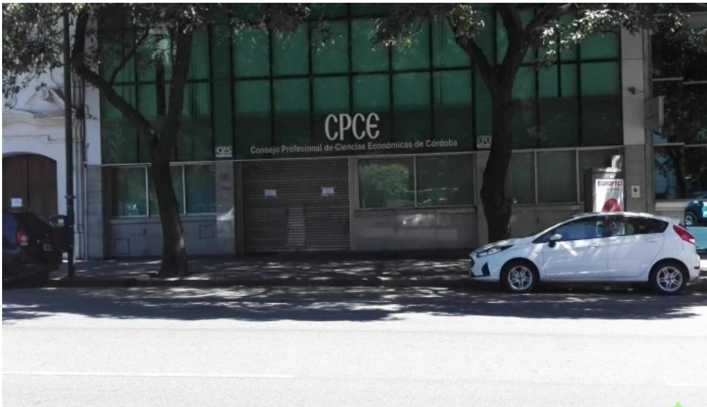
Caja de prevision social para profesionales en ciencias economicas de cordoba puntaje