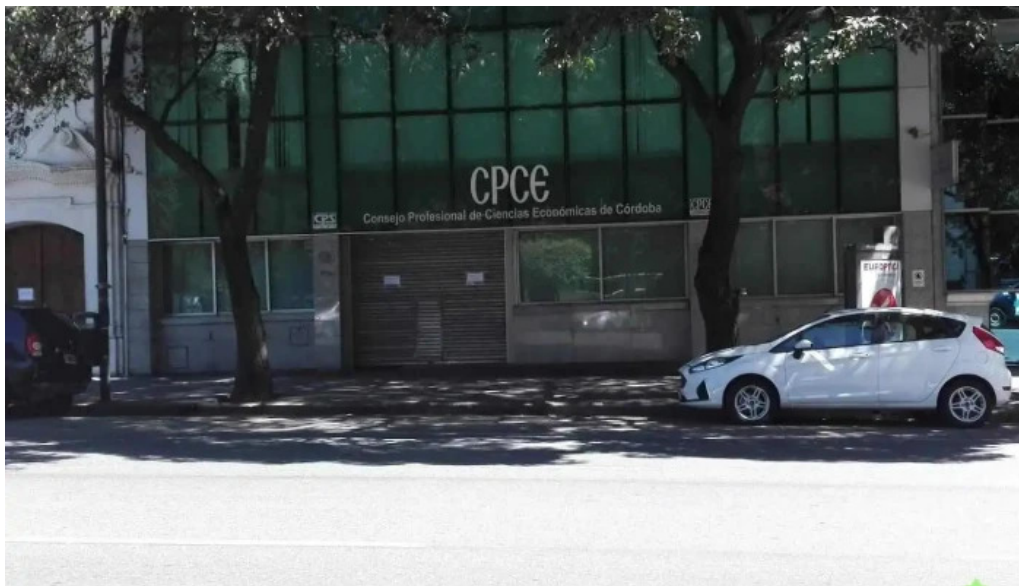
Caja de prevision social para profesionales en ciencias economicas de cordoba cordoba