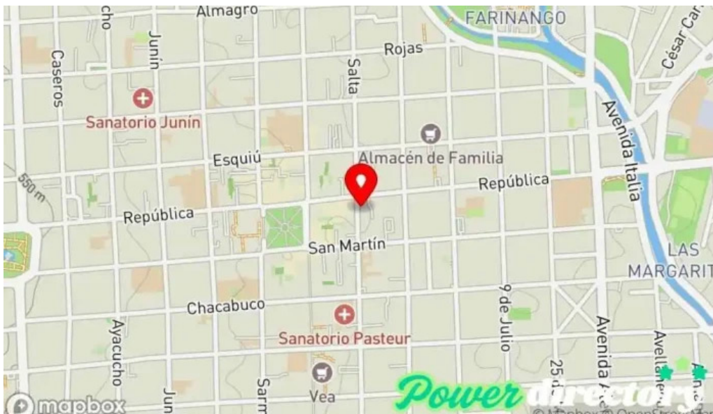
Asociacion mutual de proteccion familiar mapa