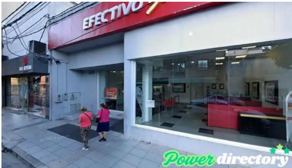
Asociacion mutual de proteccion familiar san fernando del valle de catamarca