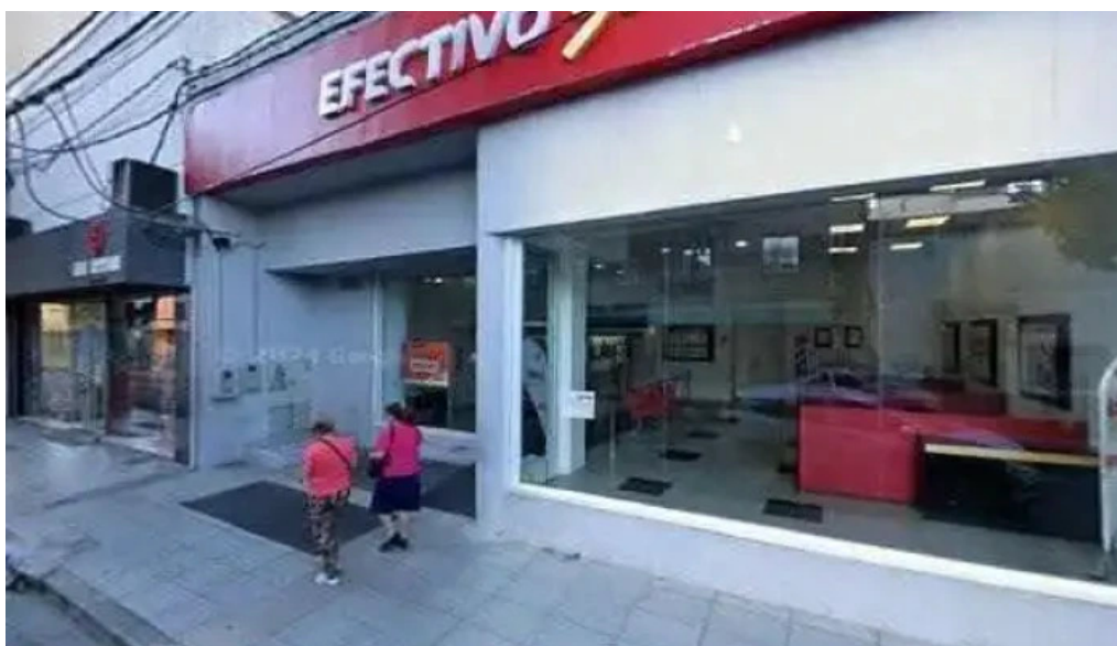
Asociacion mutual de proteccion familiar horario