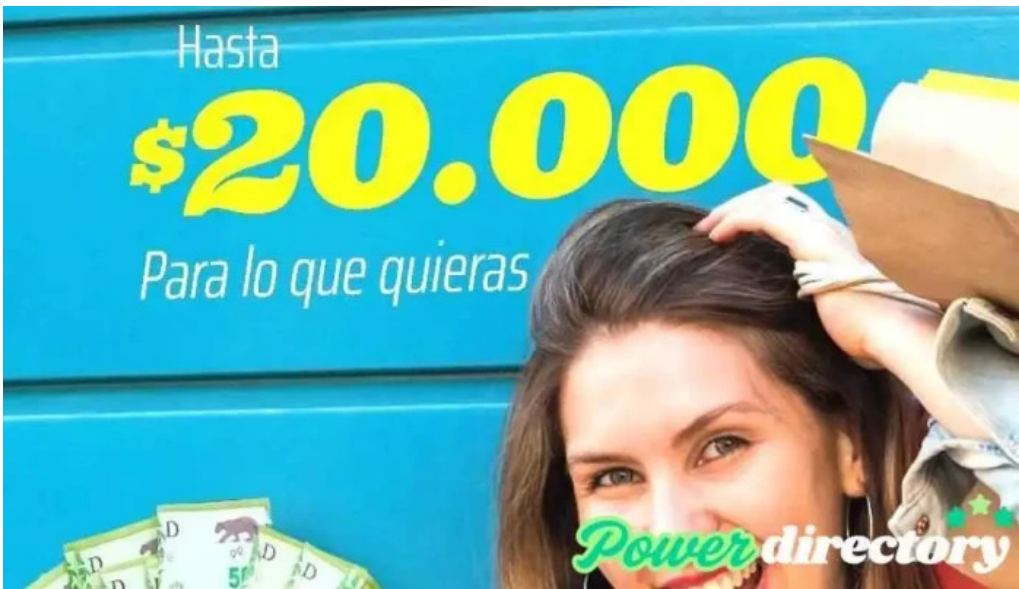
Mutual vida plena cordoba