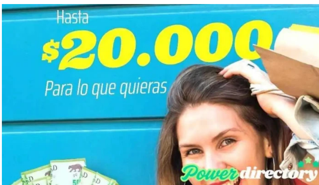
Mutual vida plena como llegar