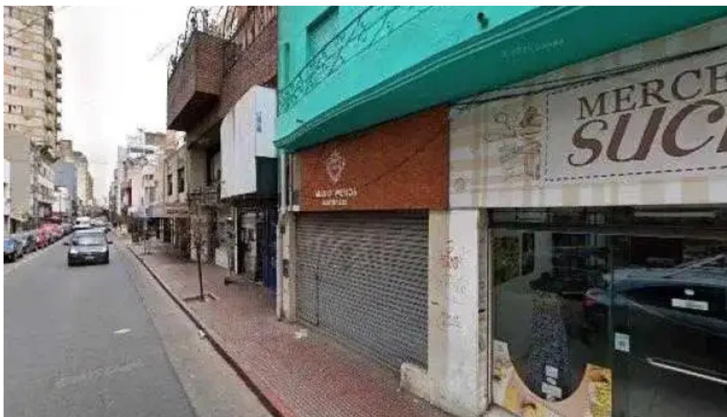
Mutual vida plena como llegardeg