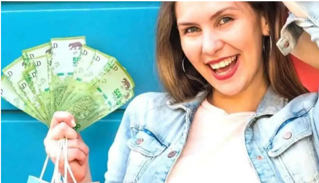
Mutual vida plena del propietario