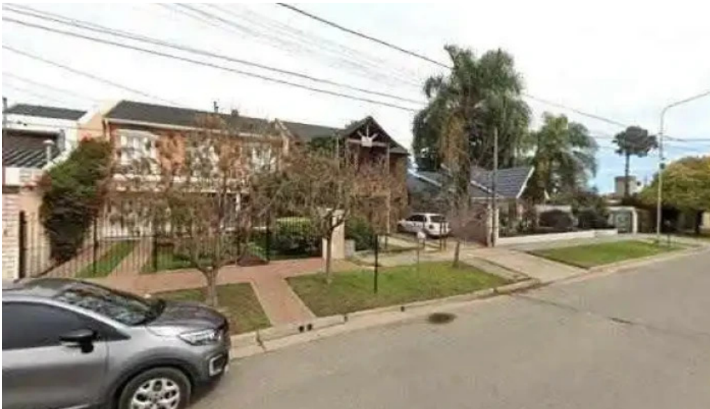
Asociacion mutual de proteccion familiar zona