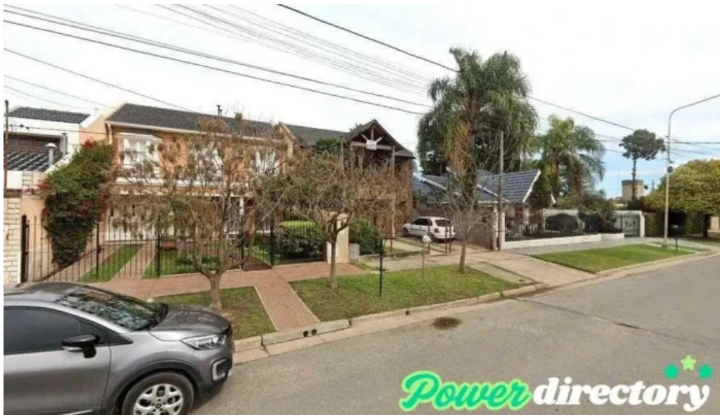
Asociacion mutual de proteccion familiar carcarana