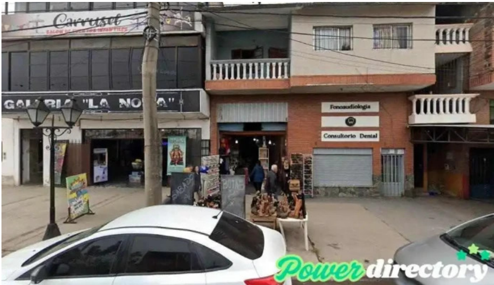
F f creditos san salvador de jujuy