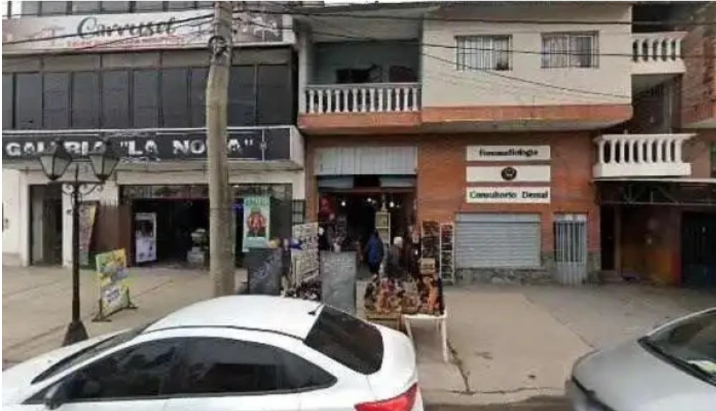
Ff creditos catalogo