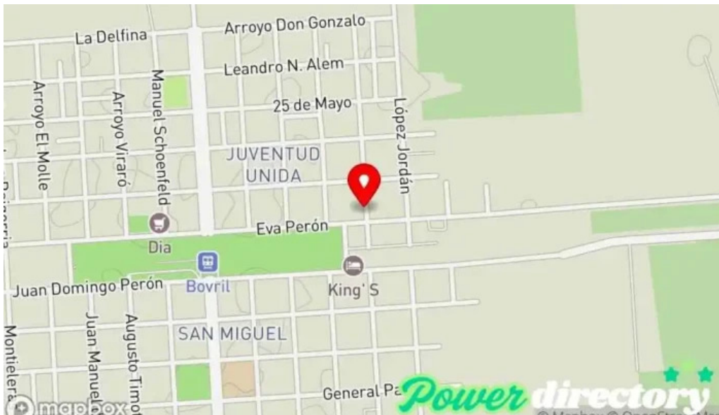
Seguros la segunda y gestoria automotor mapa