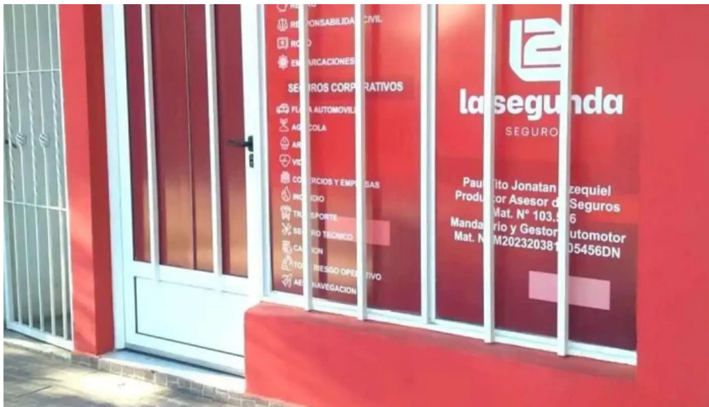
Seguros la segunda y gestoria automotor bovriil