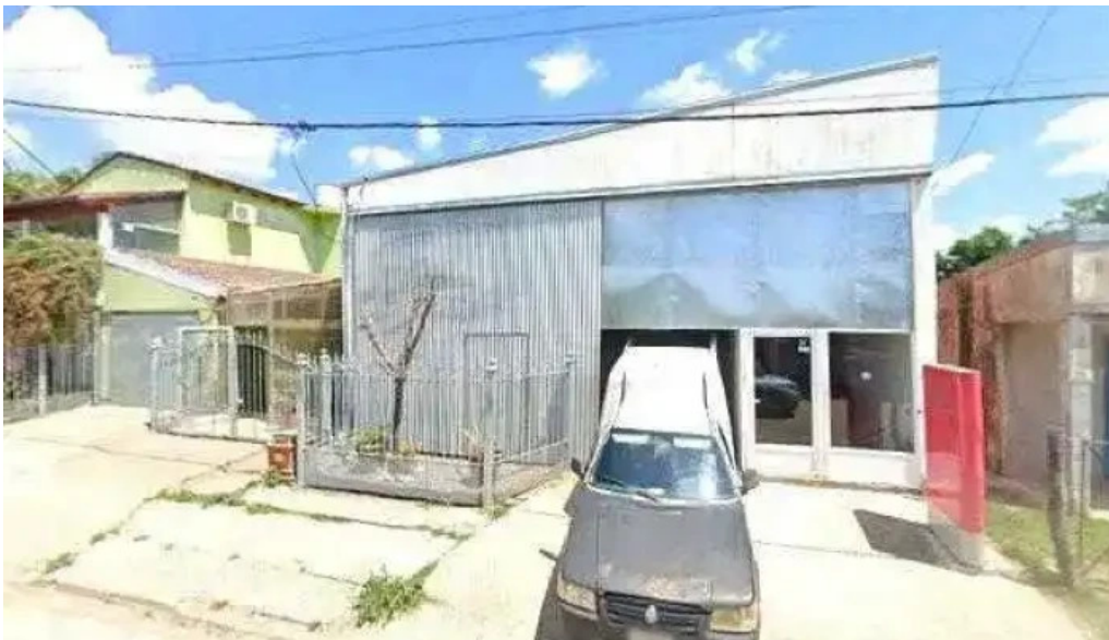
Seguros la segunda y gestoria automotor telefonodeg