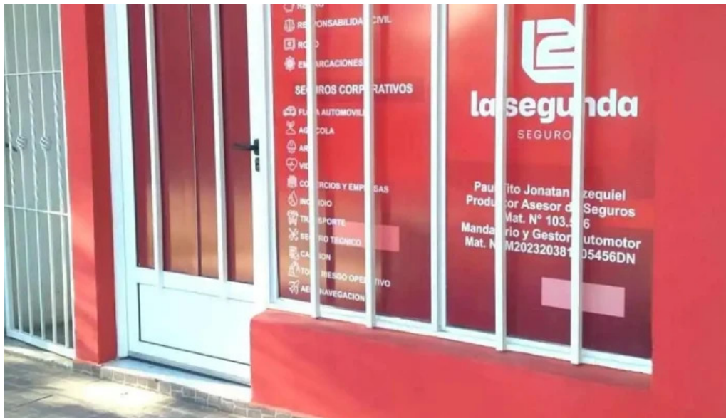
Seguros la segunda y gestoria automotor telefono