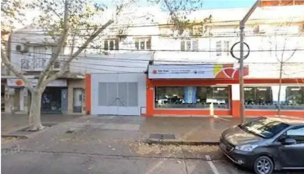
Caja de accion social cas instagram