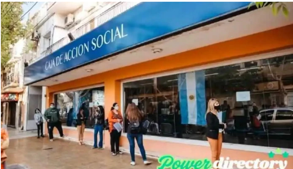
Caja de accion social cas edificio