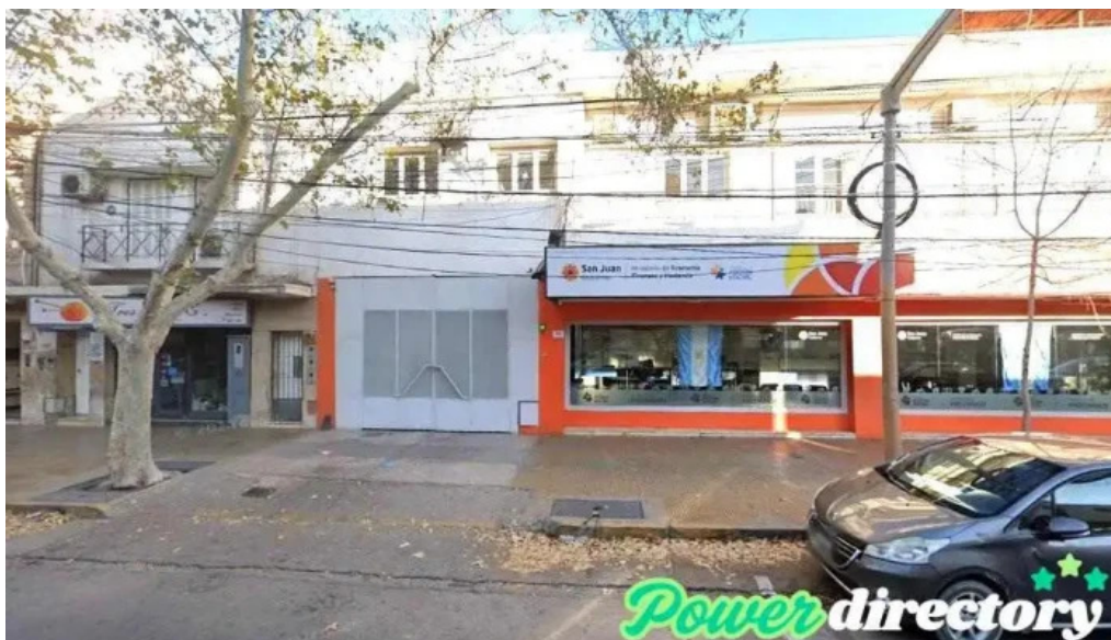
Caja de accion social c a s j5402gui