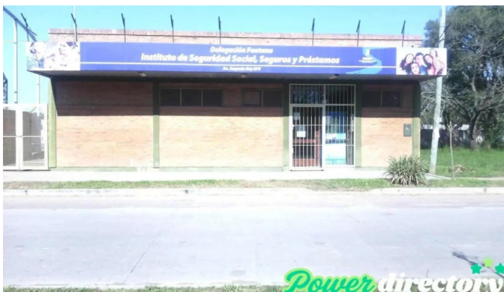
Insssep instituto de seguridad social seguros y prestamos fontana