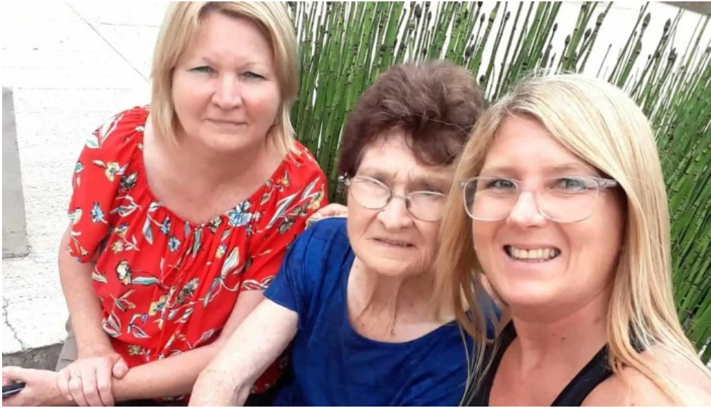
Municipio de aldea san antonio numero