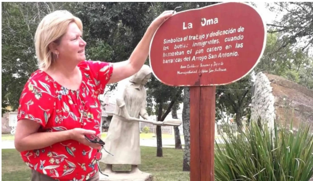
Municipio de aldea san antonio horario