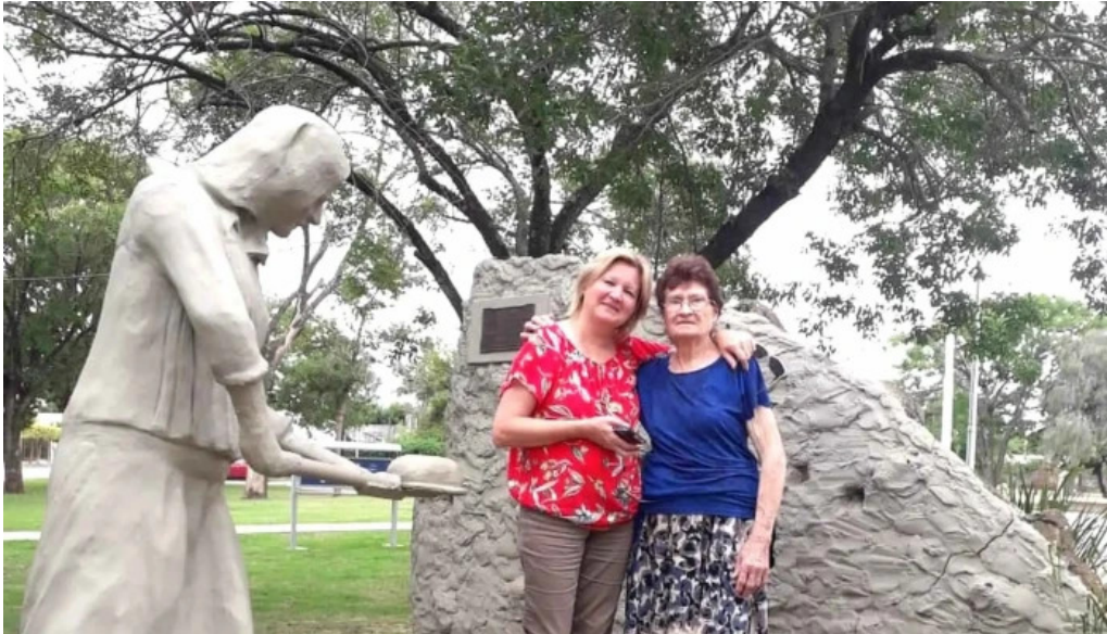
Municipio de aldea san antonio aldea san antonio