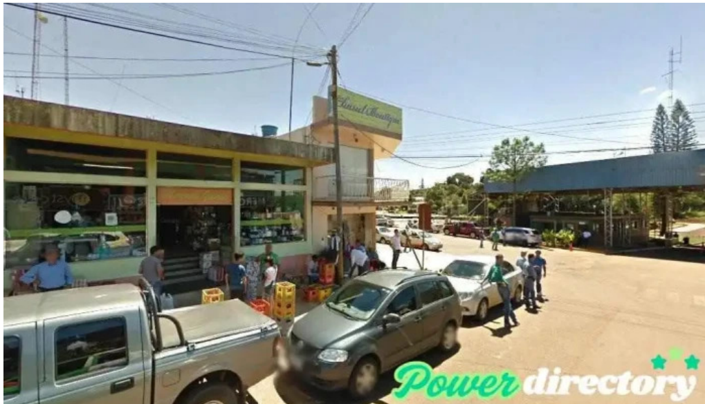
Dos arroyos s a sucursal bernardo de irigoyen bernardo de irigoyen