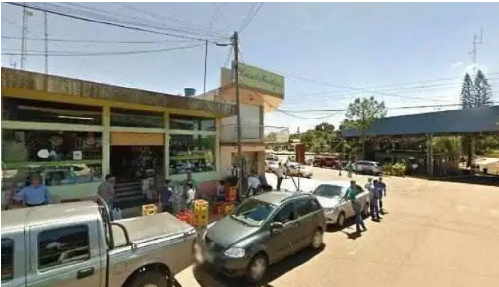
Dos arroyos sa sucursal bernardo de irigoyen precios