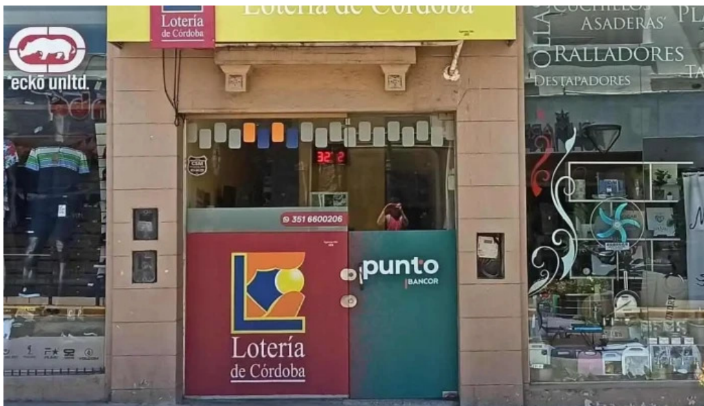
Punto dolar exterior