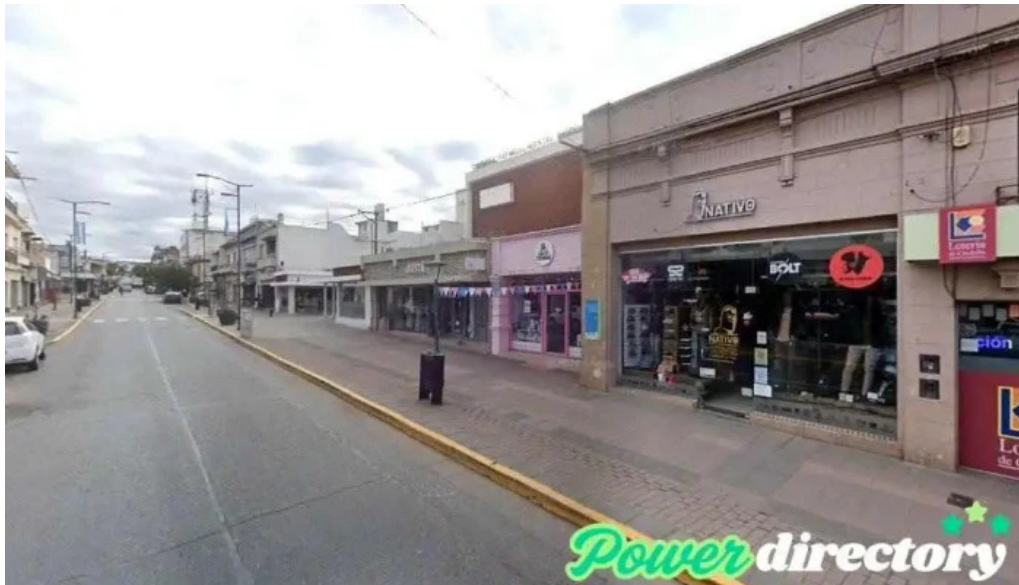
Punto dolar alta gracia