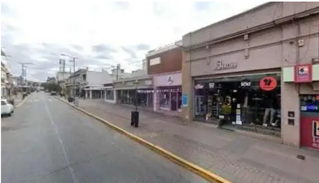
Punto dolar precios