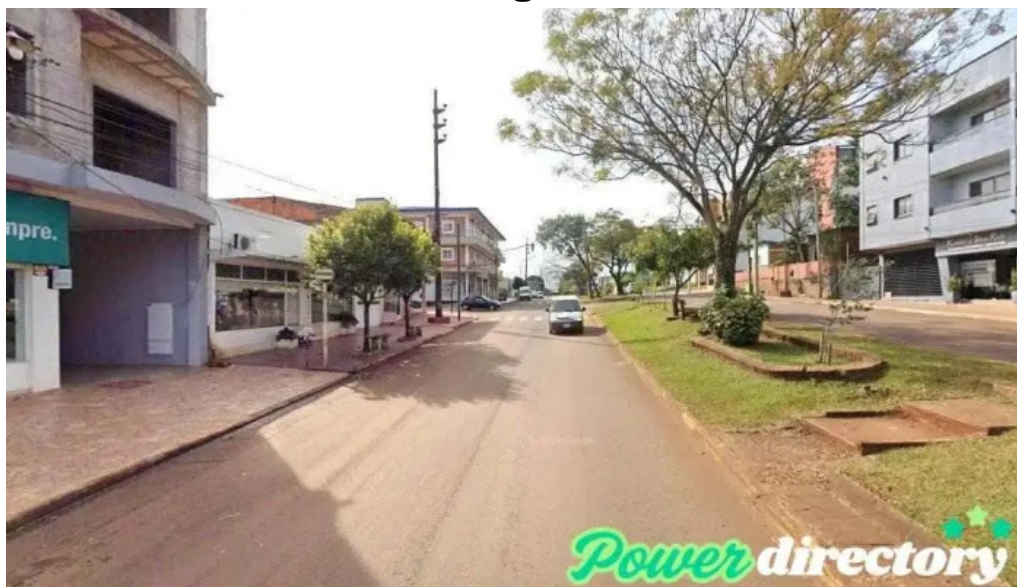
Go credil el mejor prestamo siempre san vicente