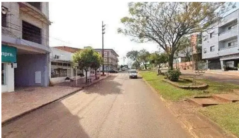
Go credil el mejor prestamo siempre puntaje