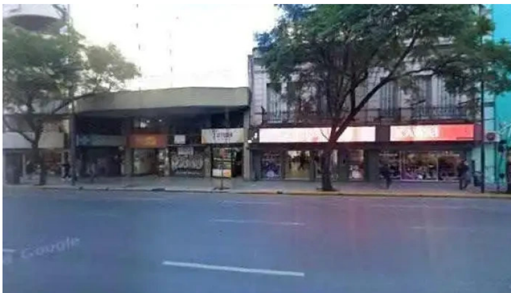
El mejor prestamo fotos