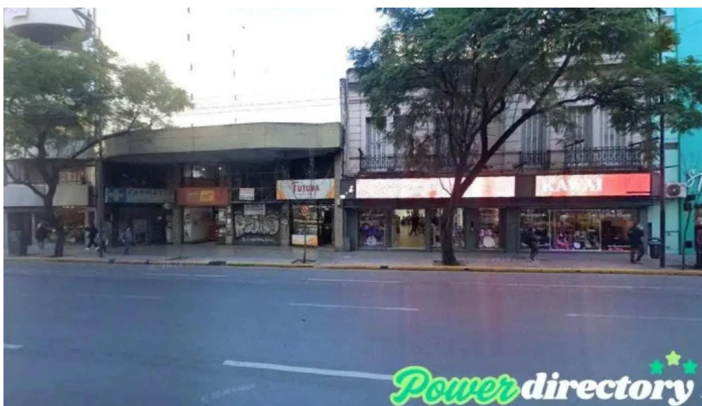
El mejor prestamo cordoba