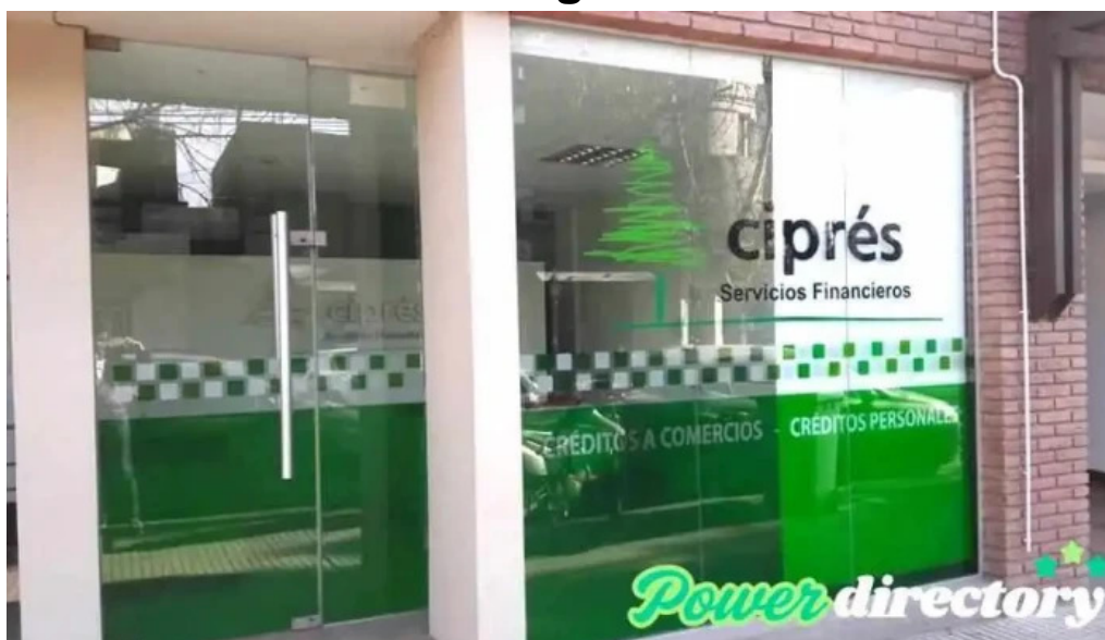
Cipres servicios financieros villa nueva