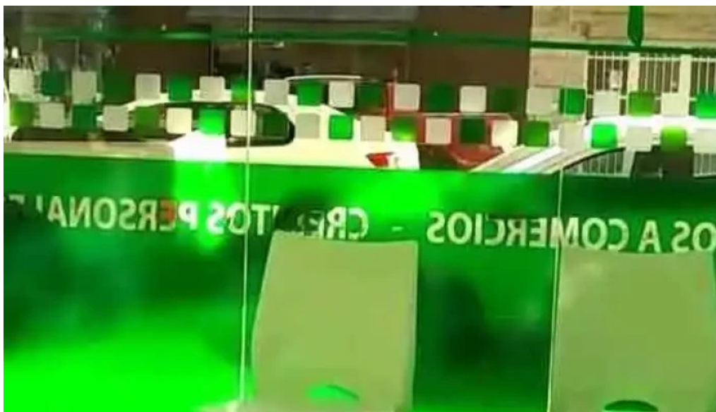
Cipres servicios financieros del propietario