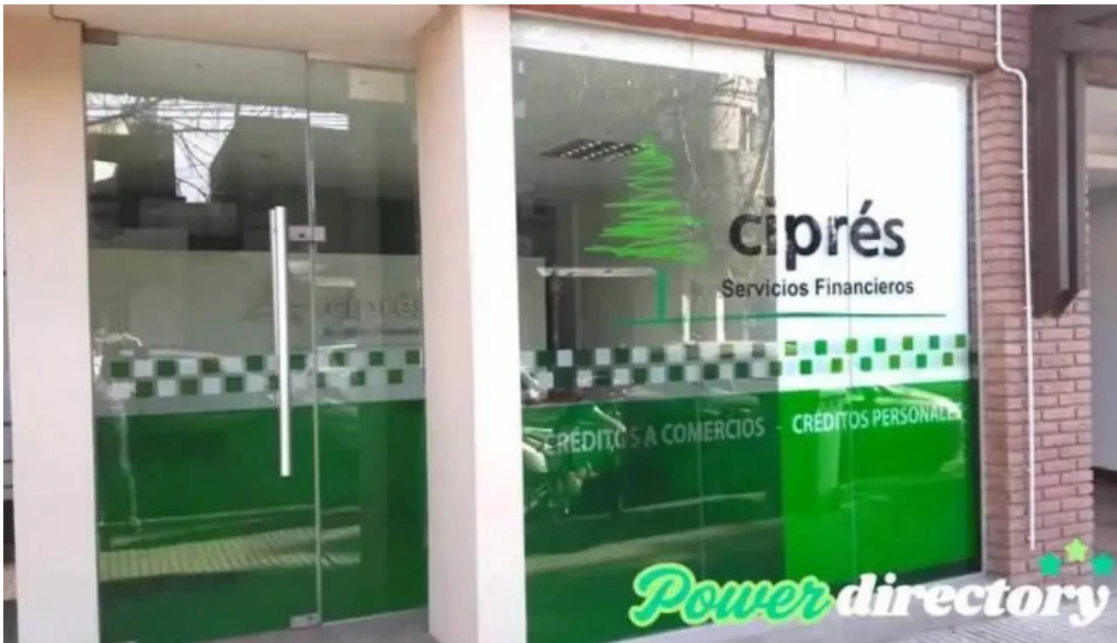
Cipres servicios financieros descuentos