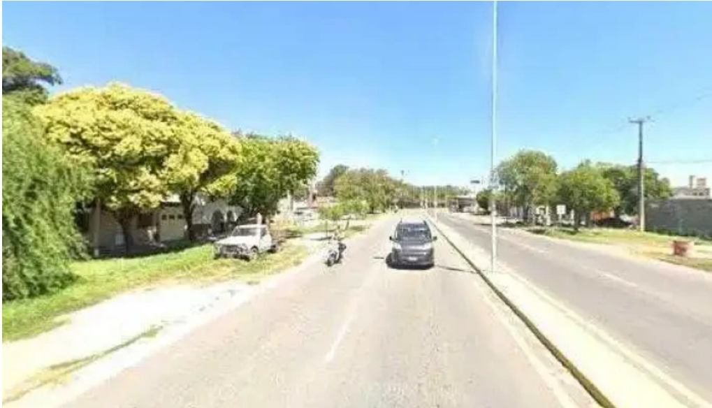
Cipres servicios financieros descuentosdeg