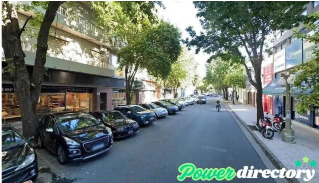
Finansol villa gdor galvez