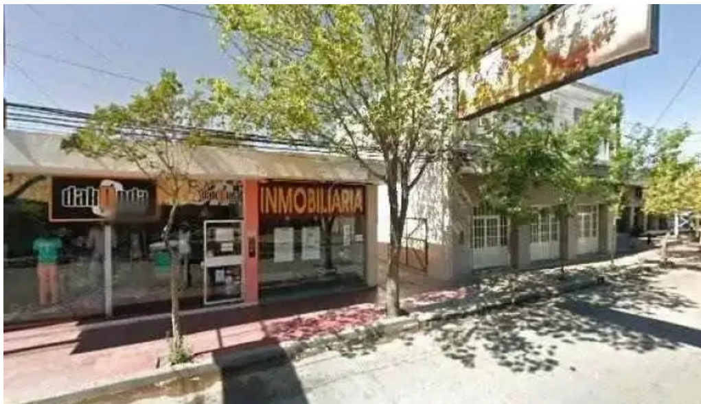
Credito argentino como llegar