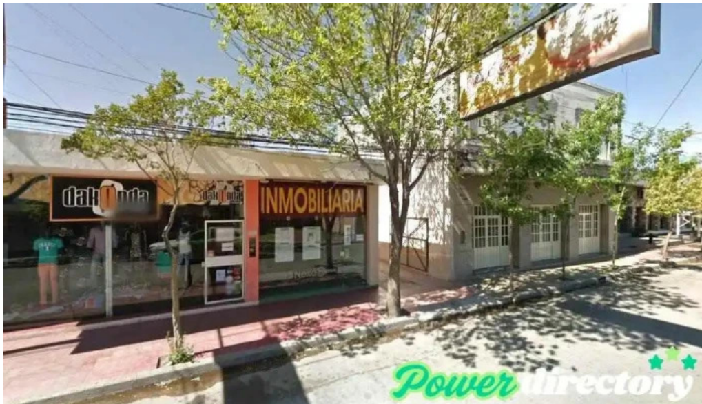
Credito argentino villa dolores