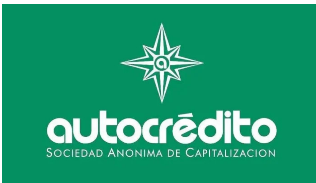
Autocredito s a del propietario