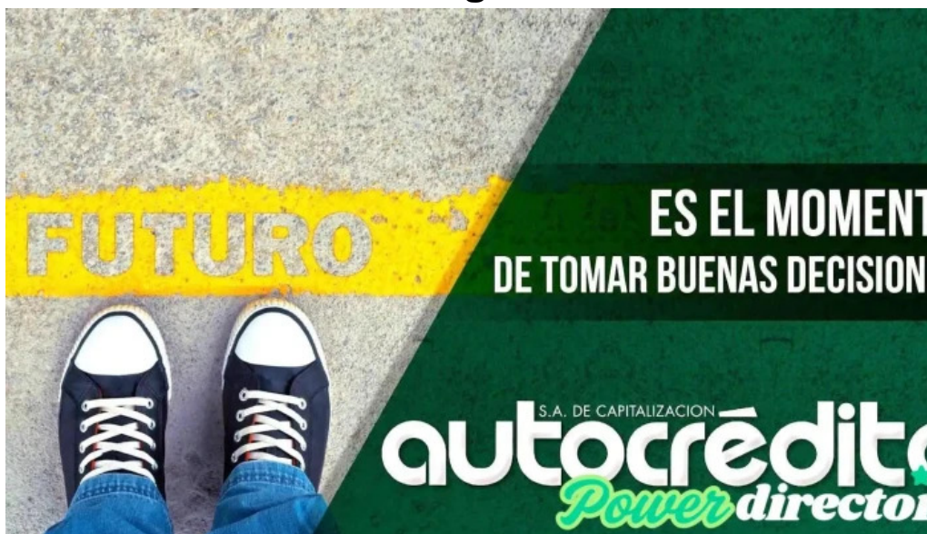
Autocredito s a villa constitucion