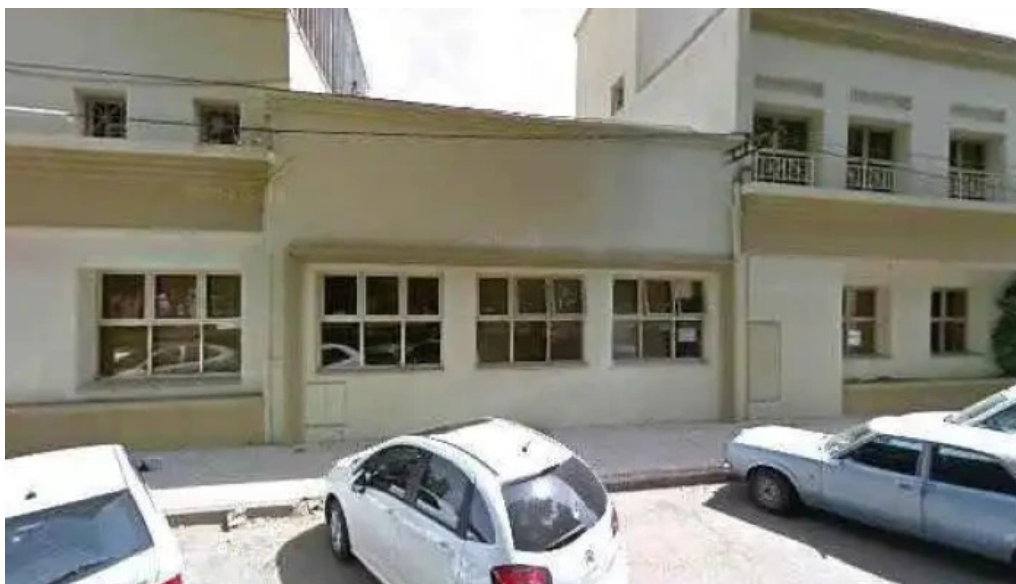
Autocredito s a donde