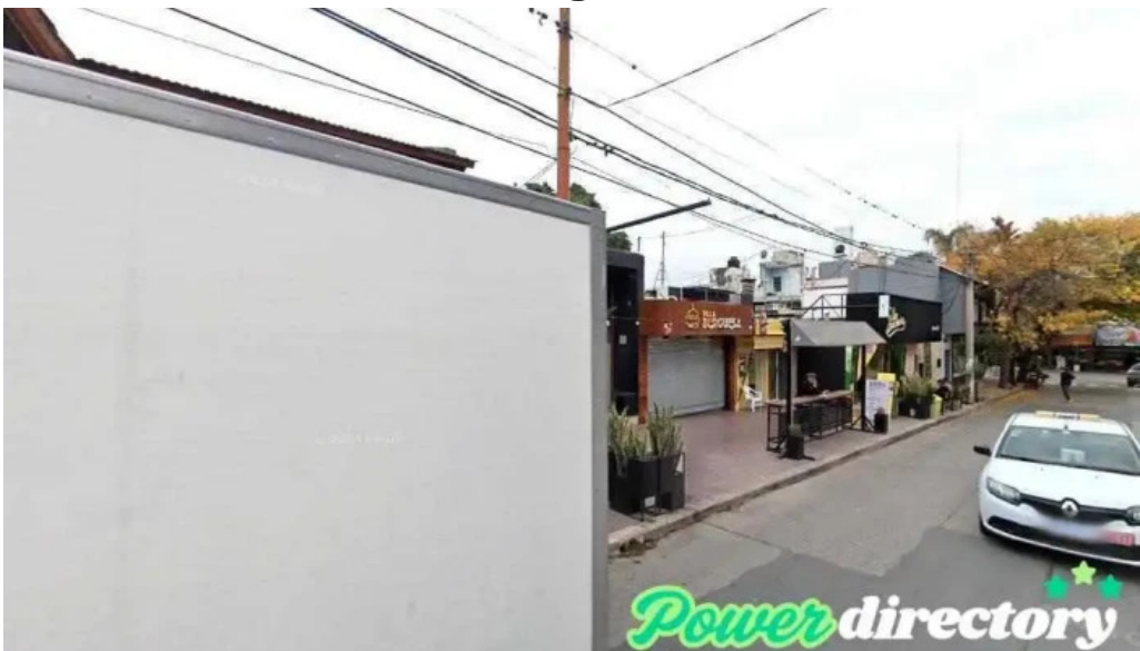
Ofys villa carlos paz