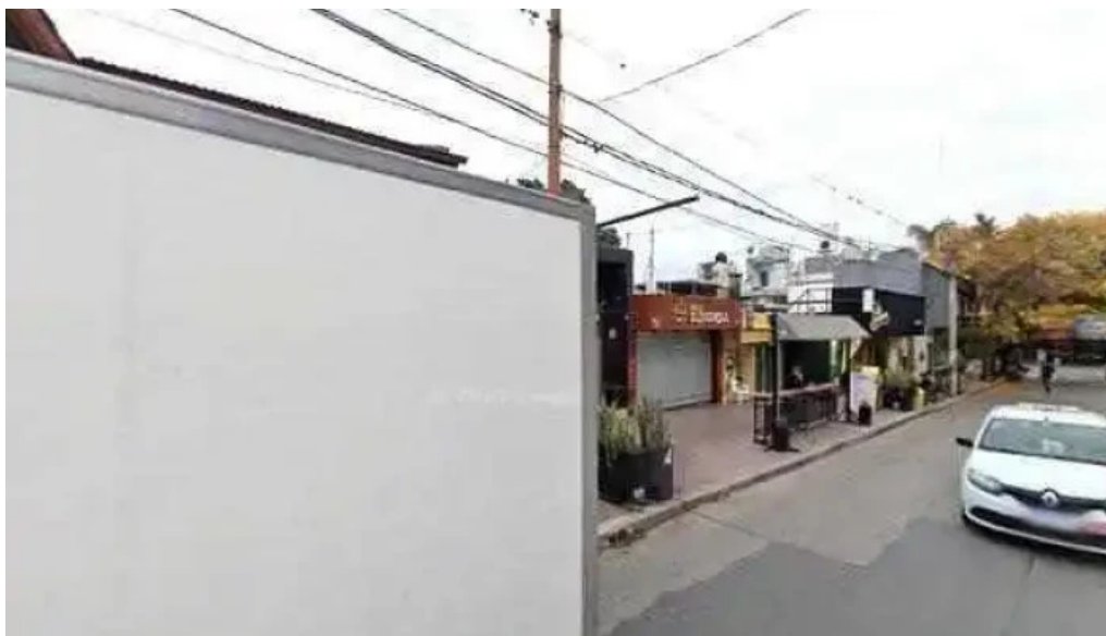
Ofys como llegar