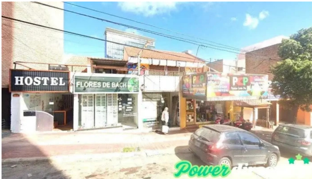
Credi ya villa carlos paz