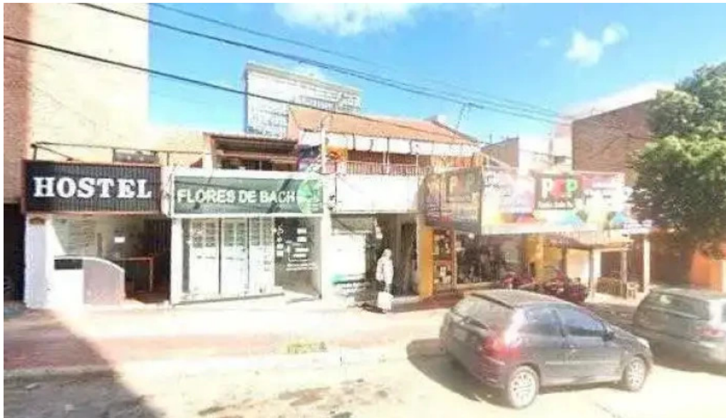
Credi ya puntaje