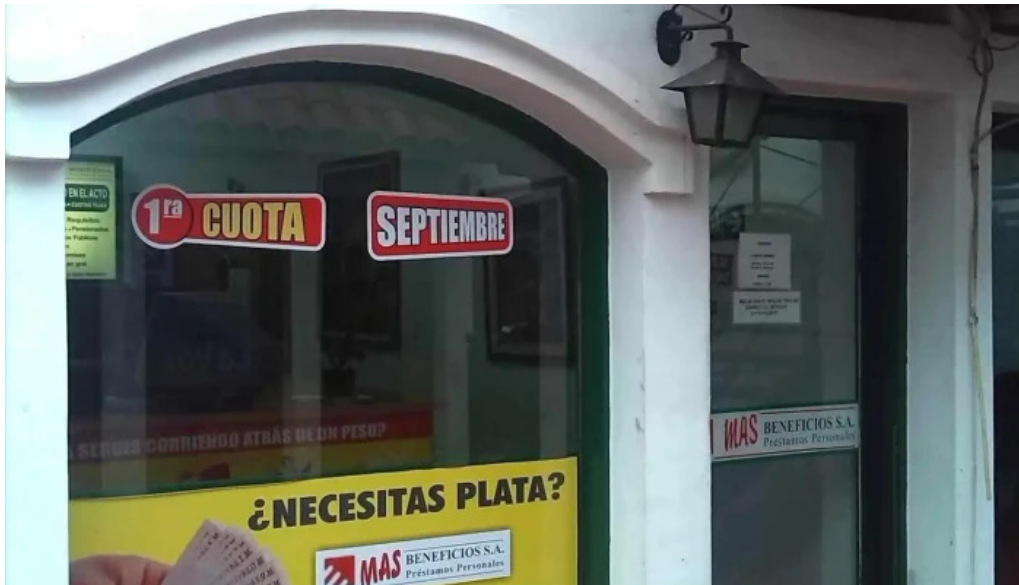
Mas beneficios sa prestamos personales exterior

MAS BENEFICIOS S.A. Préstamos Personales