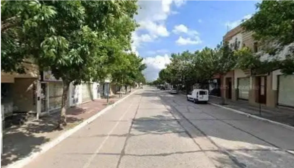
Credito argentino puntaje