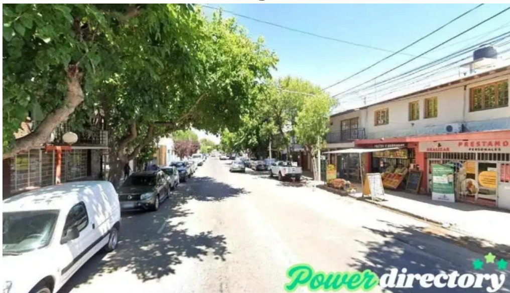
Recursos prestamos personales tunuyan tunuyan